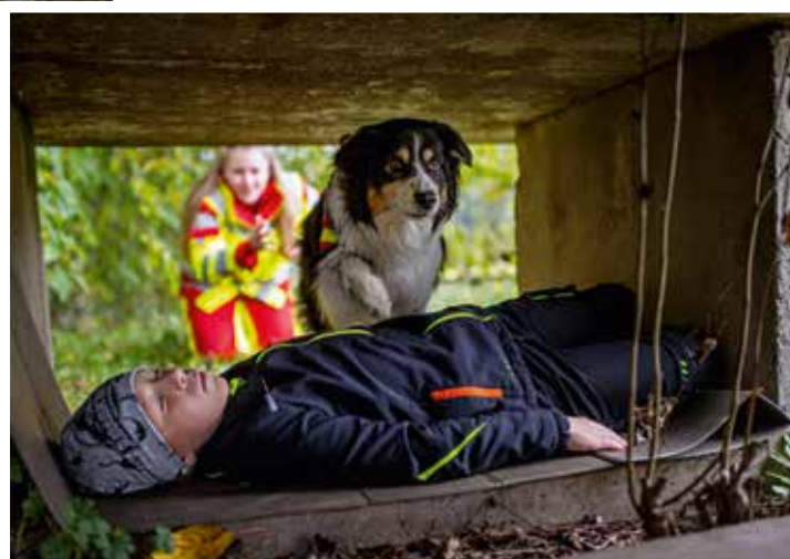
Oben: Leona und Luna beim Trainieren der Flächensuche im Wald. Rechts: Luna nimmt Fährte auf und findet den Vermissten.