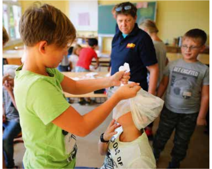
Schon Kinder lassen sich spielerisch für Erste Hilfe begeistern.

Um den Teilnehmerinnen und Teilnehmern die Krisenvorsorge möglichst realitätsnah zu vermitteln, lernen sie, Notfallvorräte selbst zu packen und einfache Wunden und Verbrennungen zu versorgen. Bei der Inszenierung einer Notsituation üben sie, einen kühlen Kopf zu bewahren und eine Überlebensstrategie zu entwickeln. Fragen wie „Was kann ich Essbares in der Natur finden?“ werden ebenso diskutiert wie: „Wie komme ich an Trinkwasser, wenn der Strom für mehrere Tage ausfällt?“